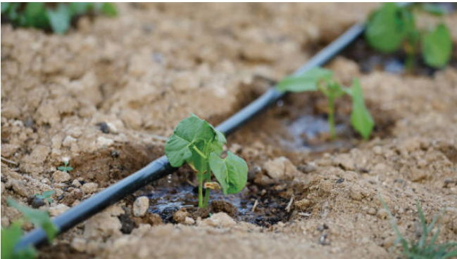
चित्र ४: विरुवाको फेदमा थोपा-थोपा चुहाएर सिंचाइ गरिदै