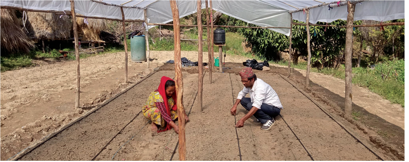
चित्र ३: पोलीहाउसमा तरकारी उत्पादनका लागि थोपा सिंचाइ प्रयोग गरिदै, डडेलधुरा