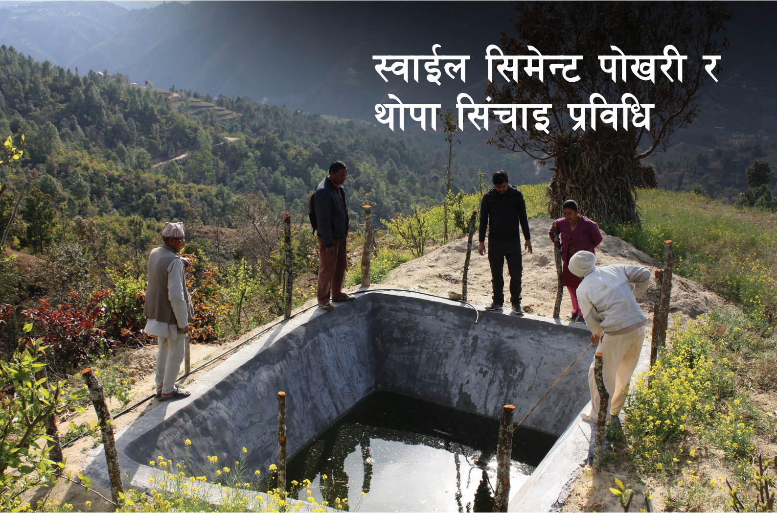
चित्र १: वारी भन्दा अग्लो स्थान छनोट गरि बनाईएको स्वाइल सिमेन्ट पोखरीमा स्थानिय सामाग्री प्रयोग गरि तारवार लगाईदै, काभ्रे जिल्ला